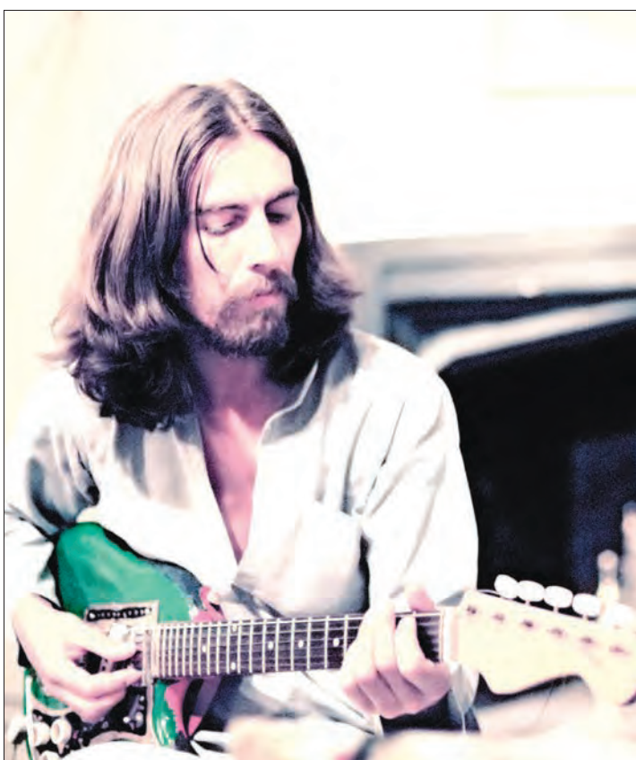
۱۳ سال پیش، برابر با بیست و نهم نوامبر ۲۰۰۱ میلادی، جرج هریسون، موسیقیدان، ترانه‌سرا و گیتاریست املی گروه موسیقی بیتلز در دهه ۶۰ میلادی، بر اثر بیماری سرطان در لس‌آنجلس درگذشت. مجله رولینگ استون در سال ۲۰۰۳ و در رده بندی ۱۰۰ گیتاریست برتر تمامی دوران، جورج هریسون را در رتبه ۲۱ قرار داد.