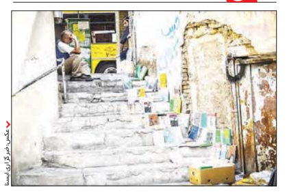
🕕 برخیکتاب فروشان کتاب های خود را در کنار پیاده رو ها به نمایش میگذار ند تاعابر ان را به خریدن و خواندن کتاب