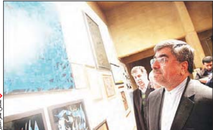
فروش خود ادامه می‌دهد و این در حالی است که روز شنبه، وزیر فرهنگ و ارشاد اسلامی از این نمایشگاه...