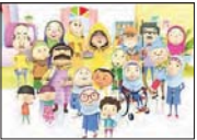
بخش سراسری سوم مجموعه «مهرتاب» خوندگی به کارگردانی فرخ کلبانه در قیاب آفرمی شود...