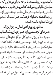
محمدرضا طایی که قرار است در جشنواره بین‌المللی فیلم مستند ایران از ۳ مستندساز و یکسکونت تقدیر می‌شود...