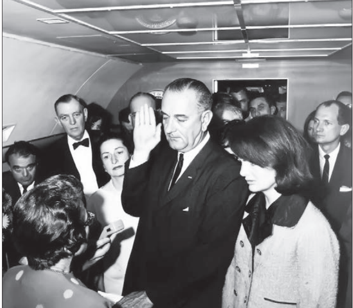
بهدون ب، جانسون، معاون اول جان اف کندی، در حال ادای سوگند به‌عنوان سنی و ششمین رئیس جمهوری تاریخ ایالات متحده آمریکا (جمعاً ۲۲ نوامبر ۱۹۶۳ میلادی) این مراسم در پی ترورجان کندی، در حین انتقال اعضای دولت ایالات به واشنگتن، در هواپیمای جت مخصوص ریاست جمهوری انجام گرفت. از آنکین کندی در این مراسم به‌عنوان شاهد حضور یافت و این در حالی بود که تاویل‌ها جان اف کندی در بخش انتهایی هواپیمای فرار داشت - توضیح در ستون تقویم تاریخ.