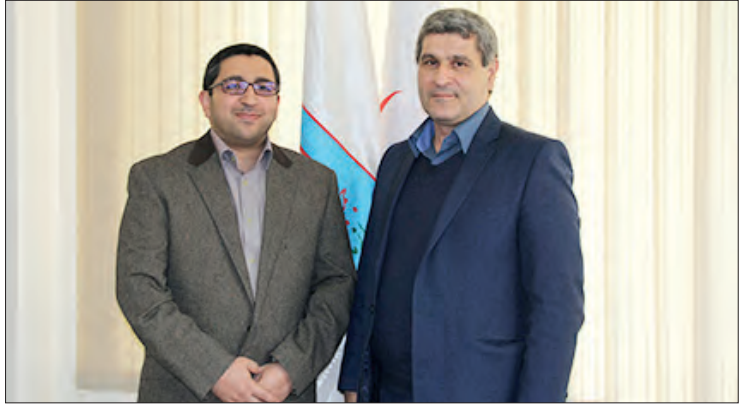
با همکاری جمعیت هلال احمر و آموزش و پرورش، آموزش و پرورش و جمعیت هلال احمر مجریان برگزاری دوره‌های دادرسی در دبیرستان‌ها در حال اجراست. این کار در راستای تقویت روحیه مسئولیت‌پذیری و مهارت‌آموزی دانش‌آموزان در زمینه‌های کمک‌های اولیه و احیای قلبی ریوی انجام می‌گردد. در این راستا، رئیس سازمان جوانان هلال احمر ضمن تقدیر از مشارکت معاونت

آموزش و پرورش و جمعیت هلال احمر مجریان برگزاری دوره‌های دادرسی در دبیرستان‌ها در حال اجراست. این کار در راستای تقویت روحیه مسئولیت‌پذیری و مهارت‌آموزی دانش‌آموزان در زمینه‌های کمک‌های اولیه و احیای قلبی ریوی انجام می‌گردد. در این راستا، رئیس سازمان جوانان هلال احمر ضمن تقدیر از مشارکت معاونت