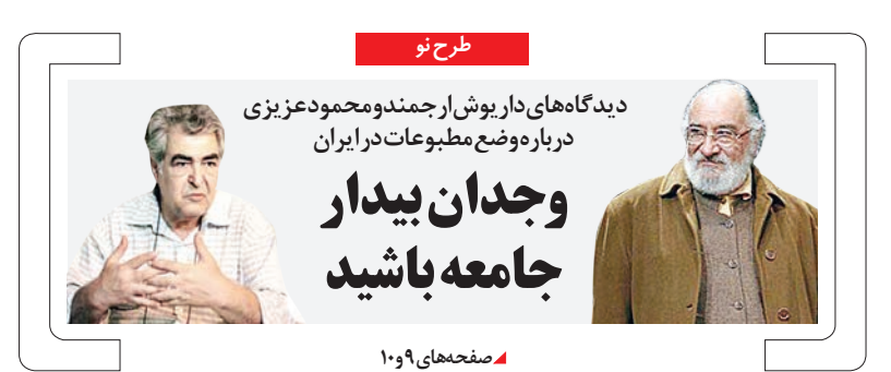
دیدگاه‌های دار یوش از جمدن و محمود عزی بزی در باره وضع مطبوعات در ایران

همایش ملی اعتدال روز گذشته با حضور برخی از چهره‌های سیاسی و فرهنگی و با قرابت پیام حسن روحانی، ریاست جمهوری، در محل کتابخانه ملی آغاز به کار کرد. حجت‌الاسلام والمسلمین سیدحسن خمینی، محمدنهادیان رئیس دفتر رئیس جمهوری، حسام‌الدین آشنا مشاور فرهنگی رئیس جمهوری، حجت‌الاسلام والمسلمین علی یونسی دستیار ویژه رئیس جمهوری در امور اقوام و اقلیت‌های دینی و مذهبی در این همایش حضور داشتند. حجت‌الاسلام والمسلمین سیدحسن خمینی در سخنانی در این همایش با بیان این که با دشمنی کردن، تلخی کردن و افراط‌گرایی جامعه از بین می‌رود، اظهار