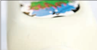
عکس شهرود | این یک نمونه از شیر شهرود است که تاریخ تولید آن ۹۳/۰۹/۰۹ است اما در تاریخ ۹۳/۰۹/۲۰ توزیع شده است

شهروند | شرکت جوانان در یک تخلف آشکار شیر تولید روز ۹۳ آبان ۱۳۹۲ را با تاریخ ۲۰ آبان توزیع کرد. پیش از این بارها این تخلف از سوی مردم اعلام شده بود اما مسئولان رسیدگی لازم را انجام ندادند.