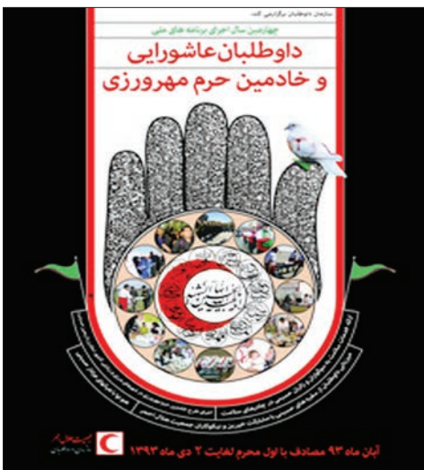
رئیس سازمان داوطلبان جمعیت هلال احمر در خصوص برنامه‌های فرهنگی و مذهبی طرح داوطلبان عاشورایی به برپایی عزاداری سنتی

رافع در خصوص طرح داوطلبان عاشورایی در خصوص سالمندان نیز گفت: «بر اساسی برای دلجویی از سالمندان بدون فرزند که نمی‌توانند در مراسم عزاداری شرکت کنند در منازل آنان اجرای شود.»