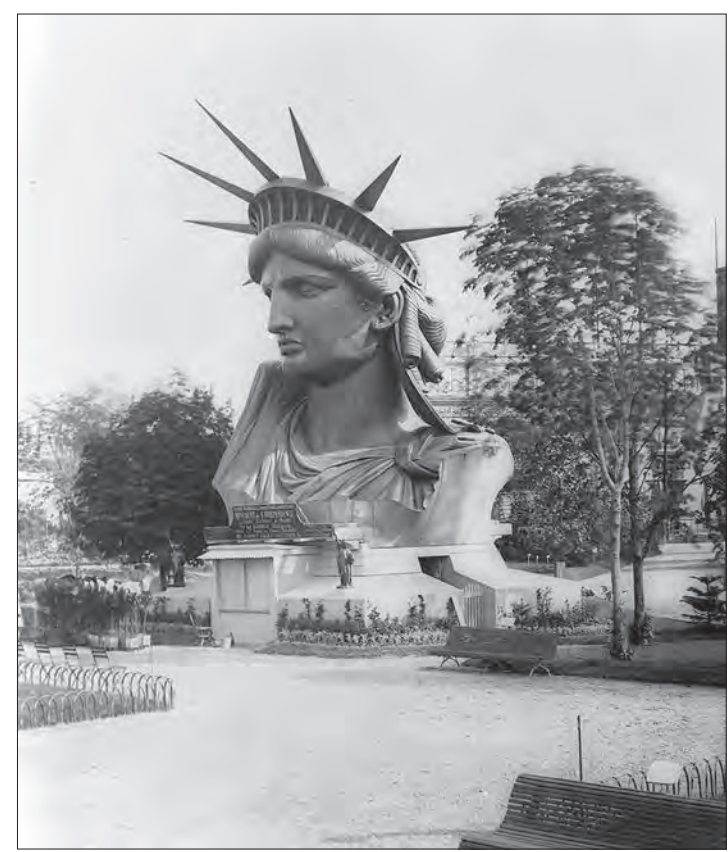
نمایش سر تکمیل شده «مجسمه آزادی» در نمایشگاه جهانی پاریس (۱۸۸۳ میلادی). این مجسمه به صورت نمادین برای خوش آمدگویی به مسافران که از راه دریا به نیویورک می آیند در جزیره آزادی نصب شده است. این تندیس به شکل شخصیت لیبرتاس (یکی از اساطیر رومی و الهه آزادی)، ساخته شده که با دست چپ خود یک لوح سنگی و با دست راست خود مشعلی فروزان را نگه داشته است. روی لوح سنگی با شماره های رومی نوشته شده JULY MDCCCLXXVI که نشانگر ۴ ژوئیه ۱۷۷۶ (میلادی) تاریخ استقلال آمریکا است - توضیح در ستون تقویم تاریخ.