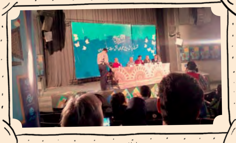
اصلا دیده نشده.

چندین روز از اختتامیه‌ی جشنواره‌ی فیلم و کودک امسال می‌گذرد. نمی‌دانم فیلم‌ها خوب دیده شدند؟ خوب نقد شدند؟ فیلم‌نامه‌نویس‌ها به طرح‌های جدیدشان فکر می‌کنند؟ کارگردان‌ها کارشان را دوباره مرور می‌کنند و به این فکر می‌کنند در کار بعدی چه کنند تا فیلم‌شان یک پله بالاتر رفته باشد؟ بازیگران چه طور؟ مشغول تمرین و دیدن بازی‌های مختلف هستند؟ همه‌ی داورها و خبرنگاران نوجوانی که در جشنواره فعالیت می‌کردند، الان در چه حال‌اند؟ حوصله‌شان که سر می‌رود، سراغ کدام کتاب یا فیلم می‌روند؟ این گزارش هنوز حال و هوای آن روزهای داغ جشنواره را دارد. شاید برای این که به یاد همه‌ی مسئولان و هنرمندان بیندازیم چه قول‌هایی دادند. این که تازه شروع کار است و این روزها، روزهای شروع جشنواره‌ی بیست و نهم است.