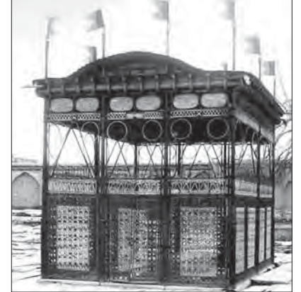
۱۰۰ سال پیش، برابری با سوئد هم اکثر ۱۹۲۴ میلادی اتانول فرانس دانستیم. ادب و فیلسوف مشهوری در گذشت شهرت فرانس در عالم ادب با انتشار داستان «جنایت سلووستر بوپل» آغاز شد. مولفان تاریخ ادبیات او را بزرگترین نویسنده فرانس در عصر خود توصیف کردند. اتانول فرانس در طی کل عمر نویسنده گی ۲۵ داستان، ۹ کتاب غیر داستانی، یک کتاب تاریخ، ۴ میناستامه و ۴ خاطره نوشت که ۴ خاطره او برتر است و اعزاز است.