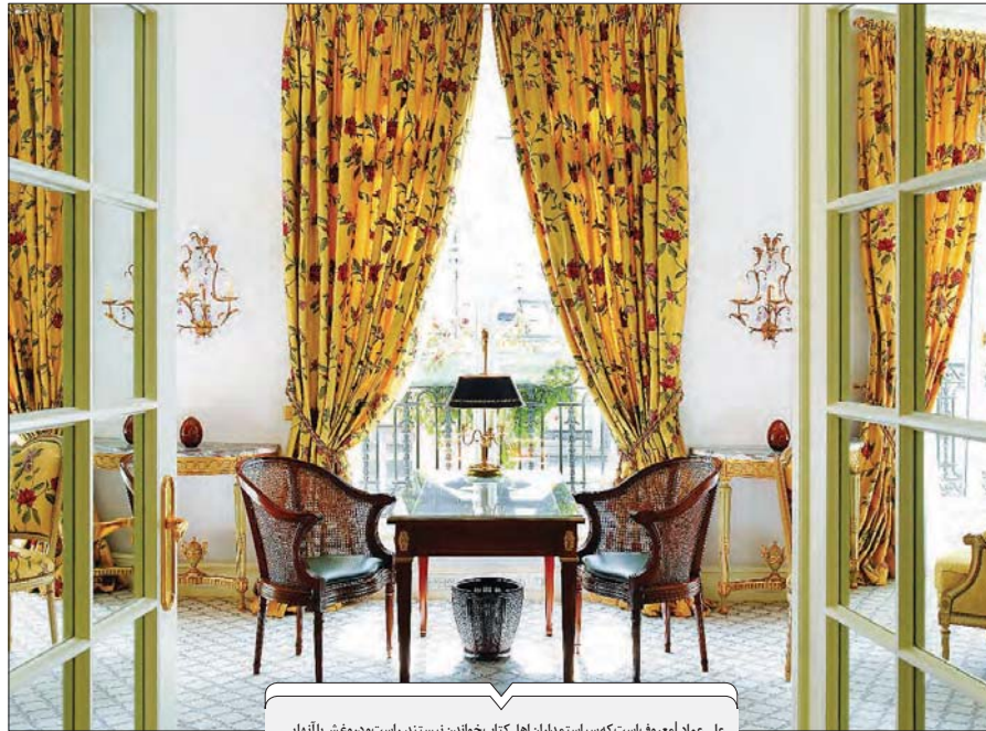
کتابخانه معرکه طعنه و آتش بیاری زهره زارملک طاهری

[ترجمه تلخیص و ویرایش زهره زارملک طاهری]