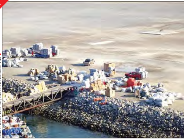
چشم انداز گسترده بندر شهید رجایی در تهران

سوال این است که چه قدرت و نیروی حامی پدیده حواشامسوجات و پوشاک است