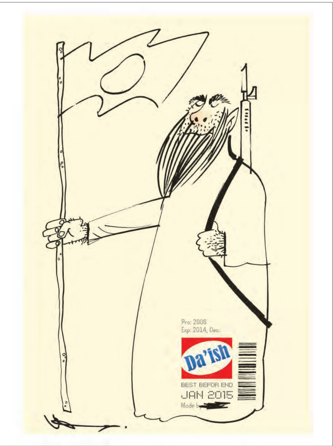
Proc. 2006 Exp. 2014, Dec. Da'ish BEST BEFORE END JAN 2015 Made in ...