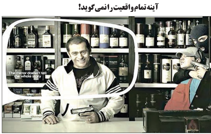
در این تبلیغ به شیوه ای خلاقانه نفاذ کور تصاویری که در آینده خود رو می بینیم نشان داده شده است.