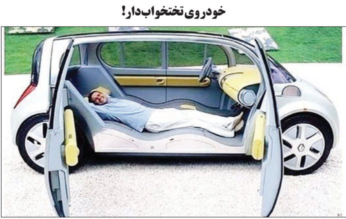
صندلی های این خودرو به شیوه ای طراحی شده است که در مواقع ضروری می تواند به تخت خوابی برای راننده تبدیل شود.