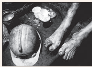
ناراحتی‌های تنفسی و درد‌های بدنی شایع‌ترین مشکل کارگران معدن است