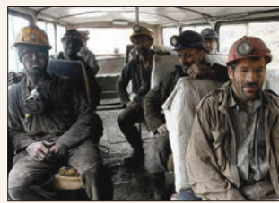
ادوات حمل و نقل در معدن هیچ‌گونه وسایل رفاهی ندارد