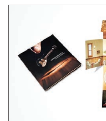
این کالای خلاقانه به شیوه‌ای طراحی شده است که جای سدی را به شیوه جادویی به فرم یک خانه تبدیل می‌کند.