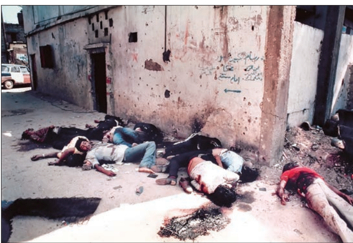
اردوگاه صبرا و شتیلا، لبنان (۱۶ سپتامبر ۱۹۸۲). شب‌نظامیان اردوگاه ۲ فالانژ ۲ روز پس از قتل بشیر جمیل، به انتقام ترور فرمانده صبرا و شتیلا در جنوب لبنان وارد شده و بین ۲۰۰ تا ۳۵۰ فلسطینی را به قتل رساندند. آریل شارون فرمانده وقت نظامیان اسرائیلی در جنوب لبنان از جمله متهمان اصلی این کشتار است زیرا حفاظت از این ۲ اردوگاه در زمان ورود فالانژ‌ها به داخل آن بر عهده ارتش اسرائیل قرار داشت - توضیح در ستون تقویم تاریخ.