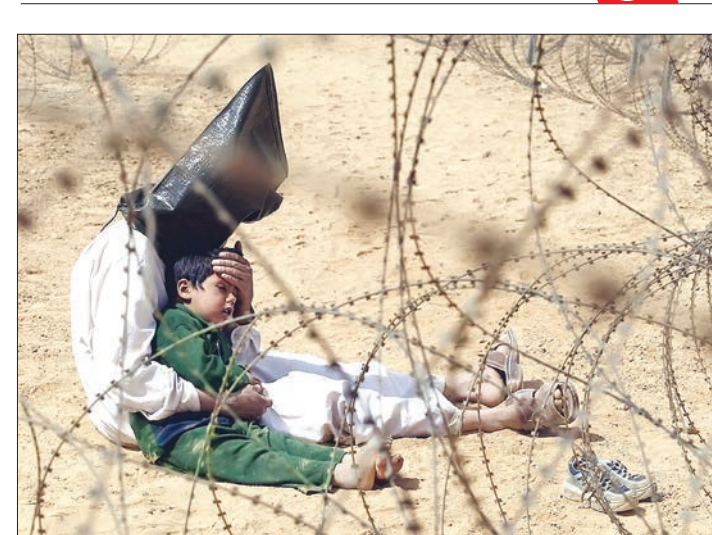
کامب لاسکر هواید ارتش ایالات متحده در شهر نجف (سپتامبر ۲۰۰۳) در عراقی متهم به همکاری با تروریست‌ها، پس از ۴ ساله خود را در وقت ملاقات به آغوش گرفته است. با گذشت ۱۳ سال از حادثه حمله به برج‌های تجارت جهانی و ۱۱ سال پس از سرنگونی مدام حسین، کشور عراق همچنان دستخوش ناآرامی و مکتب برای جوانان تروریست‌هاست.