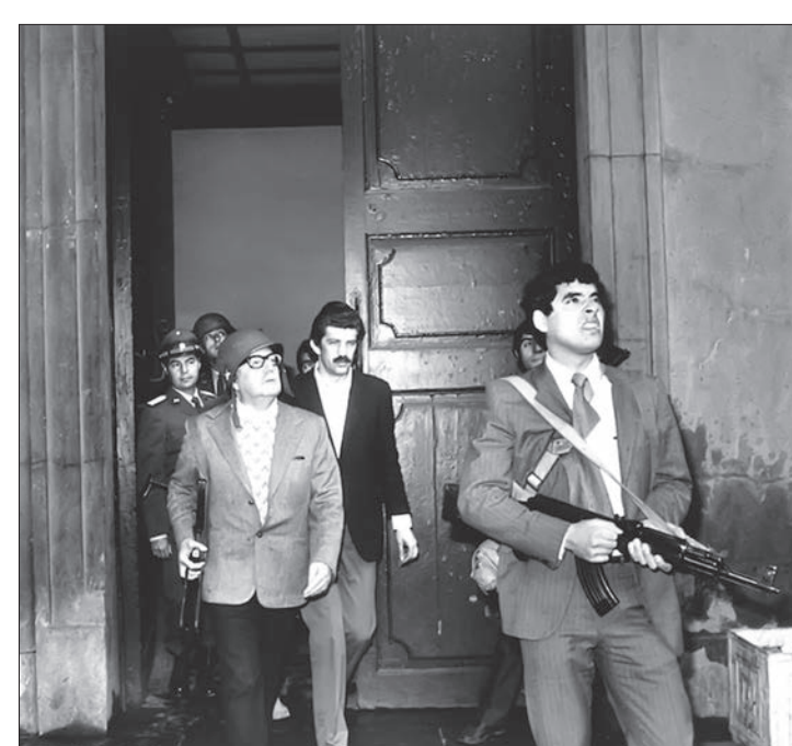
آخرین عکس ثبت شده از سالوادور آندة، رئیس جمهوری منتخب مردم شیلی، لحظاتی قبل از بمباران کاخ ریاست جمهوری و حمله واحدهای نظامی کودتاگر به فرماندهی ژنرال پینوشه (۱۱ سپتامبر ۱۹۷۳). به گفته منابع نظامی، آندة خواستار آتش‌بس ۵ دقیقه‌ای شده بود تا بتواند استعفا بدهد. اما نیروهای ارتش با این درخواست موافقت نکردند. بنا بر اسناد منابع معتبر، در این روز دست ۱۷۴ بعب بر کاخ ریاست جمهوری ریخته شد - توضیح در ستون تقویم تاریخ.