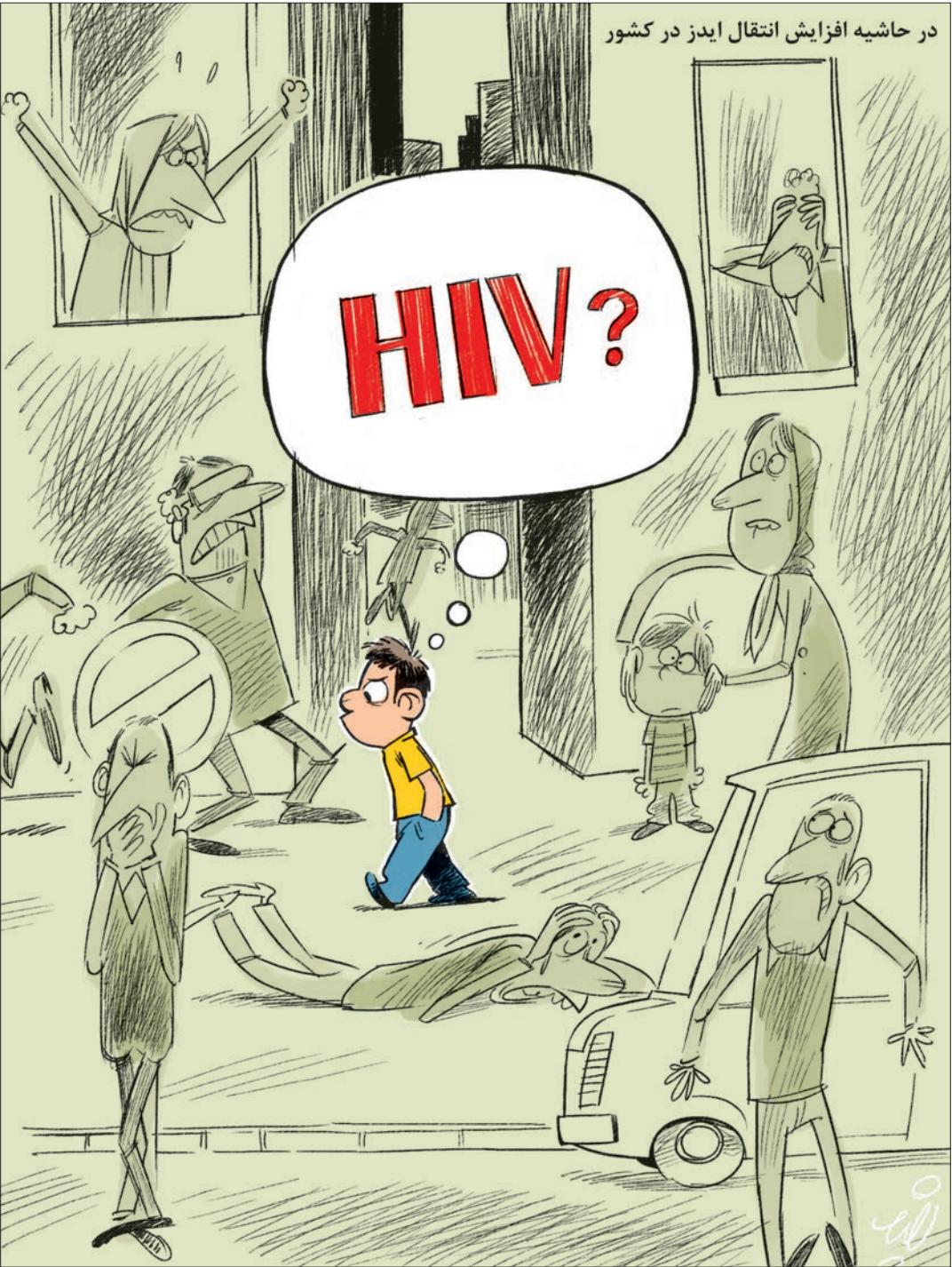
در حاشیه افزایش انتقال ایدز در کشور