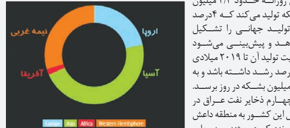
میزان صادرات نفت عراق به قاره‌های جهان

برای نشان دادن تأثیر تولید نفت عراق در بازار جهانی به مرکز سیاست‌های انرژی جهانی در دانشگاه کلمبیا اشاره می‌کنیم که بر اساس آمار سازمان انرژی آمریکا تهیه شده‌اند. البته به دلیل این که پیش‌بینی سازمان جهانی انرژی قبل از حملات داعش به شمال این کشور بوده است، احتمالاً با ادامه حضور شبه‌نظامیان در این منطقه باید پیش‌بینی‌ها را کاهش داد. بر اساس اعلام سازمان جهانی انرژی افزایش تولید نفت در آمریکا طی بلندمدت برای پاسخگویی به تقاضا کافی نیست و اوپک باید تولیدات نفت خام و گاز طبیعی خود را بیفزاید. بر اساس پیش‌بینی سازمان جهانی انرژی ۶۰ درصد رشد تولید نفت اوپک تا ۲۰۱۹ میلادی از طریق عراق تأمین خواهد شد که البته با توجه به شرایط جدید این کشور باید با احتیاط به این پیش‌بینی نگاه کرد. در حال حاضر عراق روزانه حدود ۲/۳ میلیون بشکه تولید می‌کند که ۴ درصد کل تولید جهانی را تشکیل می‌دهد و پیش‌بینی می‌شود که ظرفیت تولید آن تا ۲۰۱۹ میلادی ۴۰ درصد رشد داشته باشد و به ۴/۶ میلیون بشکه در روز برسد. یک‌چهارم ذخایر نفت عراق در شمال این کشور به منطقه داعش بسیار نزدیک هستند. سه‌چهارم دیگر در جنوب کشور قرار دارند.