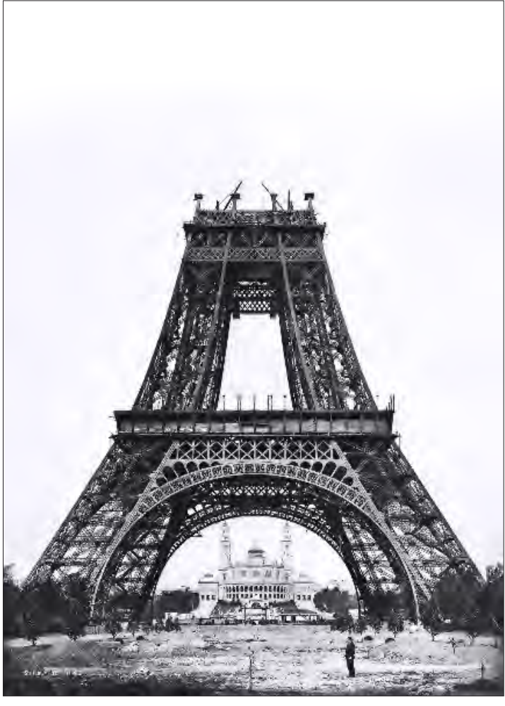
برج ایفل در پانصد و هفتاد و هفت روز از لحظه آغاز کار (سپتامبر ۱۸۸۸)، ساخت برج ایفل توسط گوستاو ایفل، در سال ۱۸۸۷ آغاز و در ۳۱ مارس ۱۸۸۹ به پایان رسید. ایفل برای نمایشگاه جهانی و به مناسبت مدین سالگرد انقلاب فرانسه ساخته شد و دو سال و دو ماه طول کشید. ایفل از ۱۸ هزار و ۳۸۸ قطعه به همراه ۲ و نیم میلیون پیچ مهره و میخ پرچ تشکیل شده است. ارتفاع برج ۳۲۴ متر و وزن آن بیش از ۱۰ هزار تن است که ۷ هزار و ۳۰۰ تن آن فولاد است.