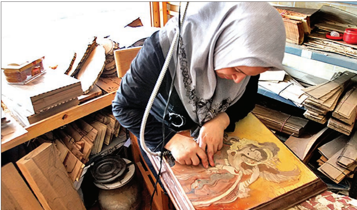
مغرقی، لچک، تریج، گل بوته، ختایی و اسلیمی، شکوفه، برگ نخل، شمشه، حیوان و انسان.