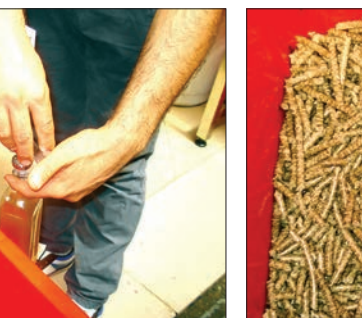
تفاله‌های خروجی از دستگاه به‌عنوان خوراک دام فروخته می‌شود