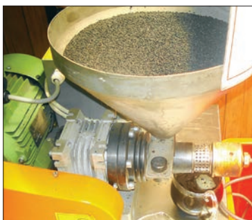
مشتریان می‌توانند دانه‌های روغنی را شخصاً تهیه کنند و در دستگاه بریزند

آنها می‌گویند مورد مشابهی از کسب و کارشان در ایران وجود ندارد و برای وارد شدن سایر افراد به این حرفه آنها را پشتیبانی می‌کنند. پدر آنها که تجربه چنددهه فعالیت در حرفه روغن گیری دارد، اصول مهم و کاربردی حرفه‌شان را به داوطلبان آموزش می‌دهد. کلاس‌ها ۲ هفته‌ای هستند و هزینه آموزش ۲ میلیون تومان است. خودشان می‌گویند در صورتی که داوطلبان تمایل داشته باشند می‌توانند ساخت دستگاه‌های روغن گیری را نیز به آنها سفارش دهند.