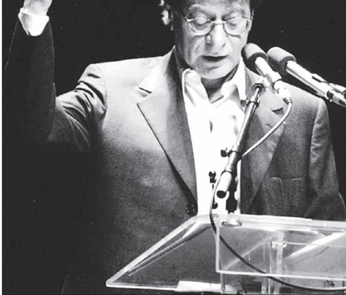
ایقون هتا، قاعدون هتا، دامنون هتا، ولتا هدف واحد واحد، اینکون وسنکون، [اینها می‌ایستیم] اینجا می‌نشیم، اینجا دانی هستیم، اینجا ابدی هستیم و همه ما یک، یک و فقط یک هدف داریم / اینک هسستیم و خواهیم بود. [شعری از محمود درویش که محمود عباس، رئیس تشکیلات خودگردان فلسطین ۳۱ سال پیش در بخش از سخنرانی خود در مجمع عمومی سازمان ملل آن را خواند - توضیح در ستون تقویم تاریخ.]