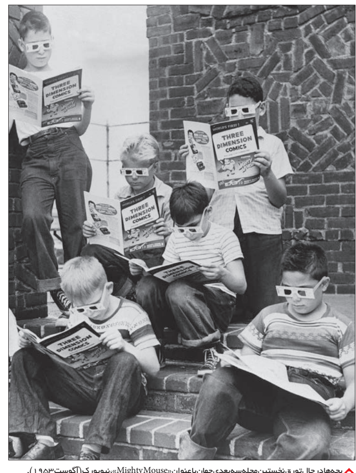
چهارمادر حال توریق نخستین مجله سه‌بعدی جهان با عنوان «Mighty Mouse»، نیویورک (اکتوس ۱۹۵۳).