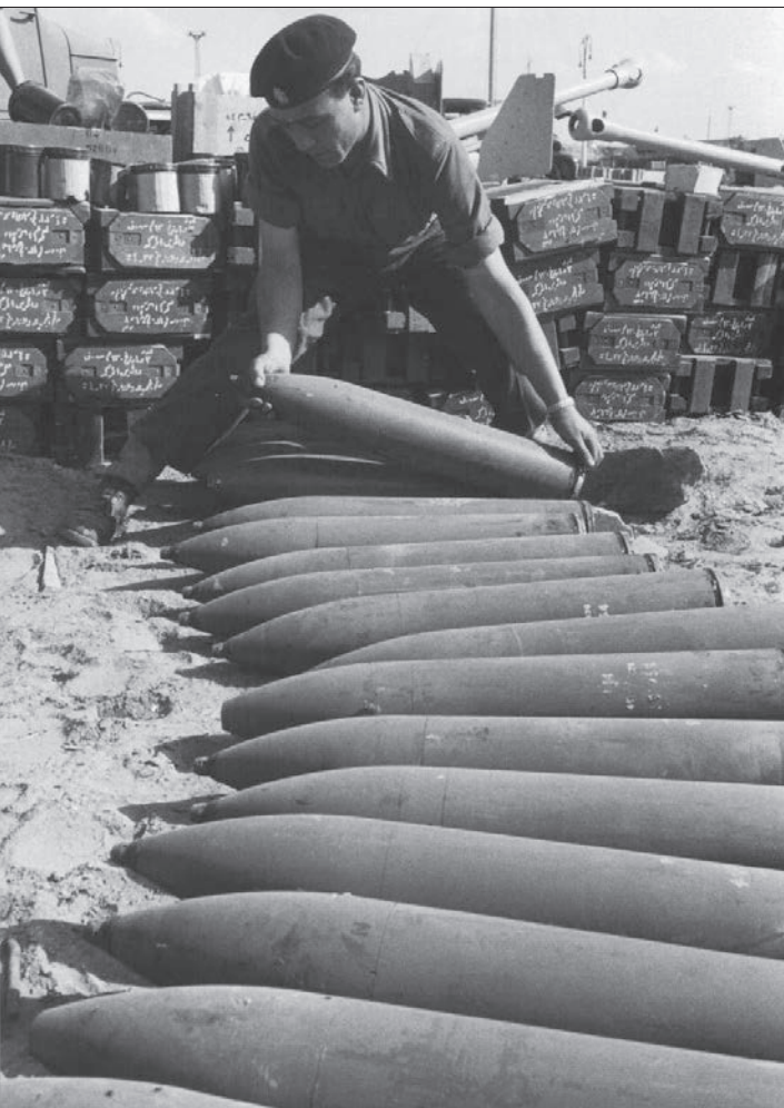
سرریز انگلیسی در حال جابجایی مهمات غنیمت گرفته شده از ارتش مصر. صحرای سینا (۱۹۵۶) انگلستان، فرانسه و اسرائیل در یک تپتی سری و بدون اطلاع ایالات متحده، ۳۰ ماه پس از ملی شدن این آب‌راه برای کنترل مجدد آن دست به حمله‌ای همه‌جانبه علیه مصر زدند اما اوتیماتوم امین شوروی و عدم همراهی عملی آمریکا، آنان را به اعلام آتش‌بس و عقب‌نشینی وادار کرد - توضیح در ستون تقویم تاریخ.