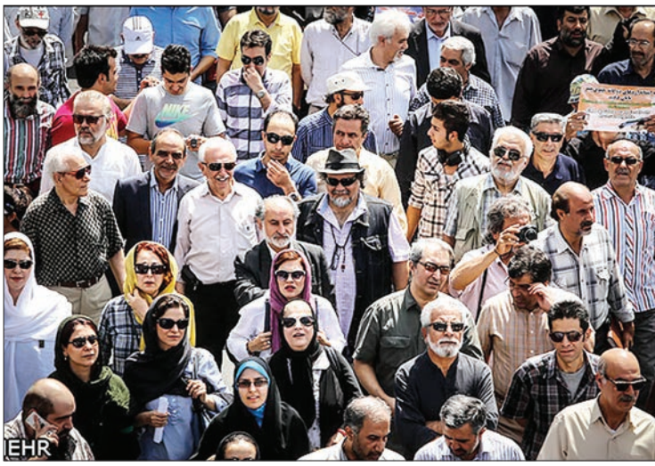
شهروند اسال‌های اشغال فلسطین توسط رژیم صهیونیست آن قدر طولانی شده که دیگر کمتر کسی از جنایات این رژیم بی‌خبر است، اما این روزها که رژیم صهیونیست اختیار از کف داده‌وبی‌وقفه موشک و گلوله بر سر مردمی که تنها مطالباتشان آزادی در وطنشان است، می‌زند دیگر کسی نیست که بوی آن انسانیت‌برده باشد و با نشیندن خیرها و دین عسکرها و ویدئوهای که از نسل کشی این رژیم در فلسطین اشغالی منتشر می‌شود، متاثر و خشمگین نشود. هنرمندان همیشه در کنار مردم و همگام با آنان در صحنه‌های مختلف زندگی حضور داشته‌اند، حتی چه بسا گاهی به خاطر روح لطیف هنرمندانه دلسوزانه‌تر و با احساس‌تر در حوزه‌های مربوط به انسان دوستی و صلح شرکت کرده‌اند. به همین دلیل خانه سینما چندی قبل از روز قدس با انتشار متنی از هنرمندان برای حضور در راهپیمایی دعوت کرد، در این متن آمده بود: «شب هیچ خانهای در جهان بی‌دیدن تصویر زنان و کودکان بی‌گناه غزه که در خون خود می‌غلطند روز نمی‌شود. غزه قهرمان سرخط خبر همه رسانه‌های جهان است. هر چند قهرمانان غزه که با سلاح‌های سبک و موشک‌های دست‌ساز پوزه‌ی از تش صهیونیستی را به خاک مالیده‌اند، اما بی‌شک پیروزی اخلاقی مردم غزه در محکمه وجدان عمومی جهان ارزشی بالاتر از پیروزی نظامی دارد. پیروزی اخلاقی مردم غزه بیش از هر چیز مدیون تصویر است. تصویری که در کنار اشغال‌گرانش شجاعان و شجاعان جوان و پویان غزه به‌سر تاسر جهان مخایه می‌کنند. سینماگران ایران که اصحاب تصویربرداری برای حمایت از مردم بی‌دفاع غزه روز قدس همپای دیگر هموطنان آزاده راهپیمایی می‌کنند تا از دولت‌ها و مجامع جهانی بخواهند هات جنایت‌های دولت‌اسرائیل را از سرزمین‌های اشغالی فلسطین کوتاه کنند» و در راستای همین دعوت بود که جمعی از سینماگران در روز جهانی قدس در مقابل خانه سینما گرد آمدند تا در راهپیمایی با هدف دفاع از مردم مظلوم غزه شرکت کنند. البته علی جنتی، وزیر ارشاد